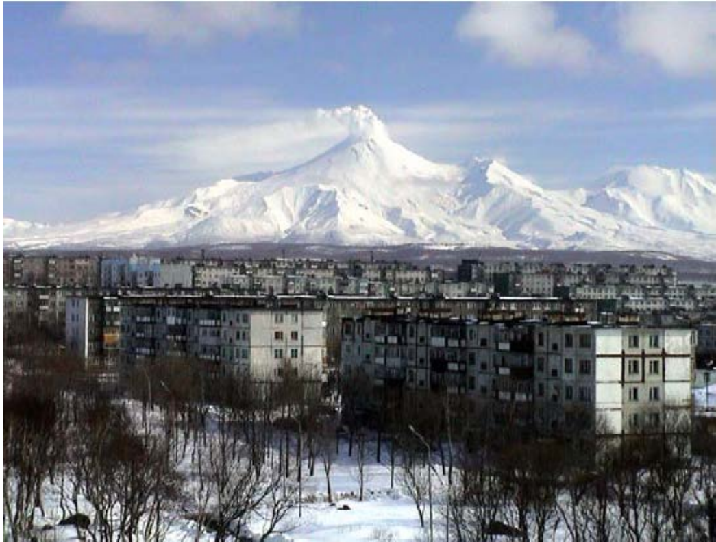
Вид на Авачинский вулкан из Петропавловска-Камчатского.

Одним из крупных было извержение 15-16 июня 1779 г., когда пепел выпал на корабли экспедиции Кука, стоявшие в Авачинской бухте. Извержение 1894-1895 гг. предварялось землетрясением. Во время извержений 1827, 1901, 1909, 1926, 1938, 1991 гг. происходило излияние лавовых потоков. Во время последнего извержения вулкана 13 января 1991 г., лава полностью заполнила кратер и излилась потоком длиной 600 м на юго-восточный склон конуса. 5 октября 2001 г. произошел единичный газовый взрыв, в результате которого лавовая пробка в кратере была расколота. В настоящее время в районе кратера наблюдается мощная фумарольная активность.