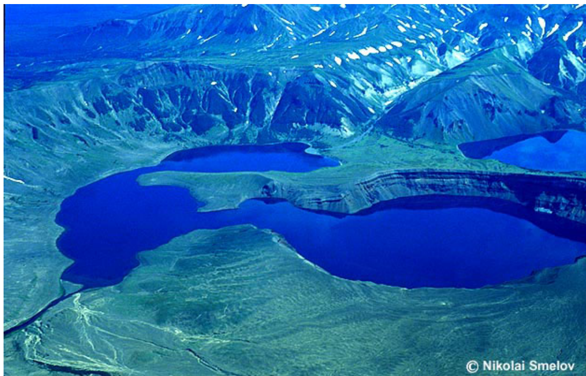
Кратер Штюбеля на вершине вулкана Ксудач.

В вершинной части вулкана расположено несколько кальдер: две крупные кальдеры, сформировавшиеся в позднем плейстоцене, и три кальдеры меньшего размера, сформировавшиеся в голоцене. Последнее кальдерообразующее извержение вулкана Ксудач, произошедшее в 250 г. нашей эры, было одним из крупнейших извержений в Курило-Камчатском регионе. По типу и параметрам оно было сходно с извержением вулкана Кракатау в 1883 г.