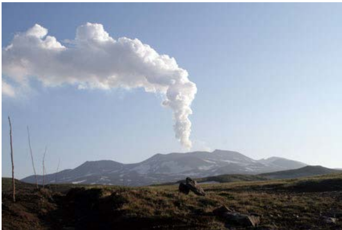
Вид вулкана Горелый с юго-запада 10 июля 2010 г.

Мы предлагаем однодневную экскурсию на вулкан Горелый. Группа выезжает на машине от ИВиС ДВО РАН в 9:00 утра и примерно в 11 ч 30 мин прибывает к подножию вулкана. Восхождение к активному кратеру на вершине вулкана Горелый продолжится около 6 часов. Возвращение в Петропавловск-Камчатский в 8-9 ч вечера. В стоимость экскурсии входит питание и доставка автотранспортом.