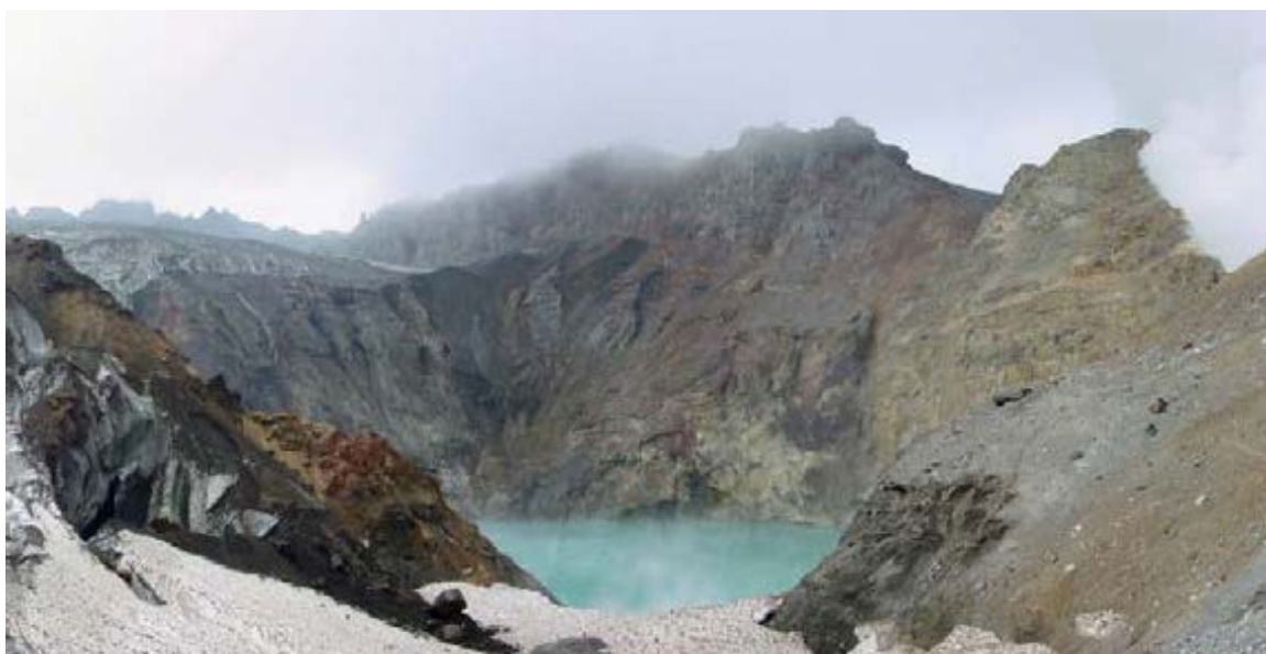
Вид на кратер вулкана Мутновский, 2003 г.

Участники этой однодневной экскурсии поднимутся в кратер вулкана Мутновский и увидят разнообразие современных гидротермальных процессов: фумаролы, кипящие грязевые котлы, горячие кислотные реки и фумарольные поля. В результате этих процессов образуются: самородная сера, алунит, опал, гематит, хлорид аммония, гипс, пирит, марказит, киноварь, халькопирит, пирротин и др.